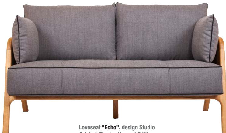
Loveseat "Echo", design Studio Brichet-Ziegler. Versant Edition

Jardins du monde en mouvement , évènement lancé par la Cité internationale universitaire de Paris, invite les candidats à réaliser des créations éphémères dans les jardins de la Cité internationale : les cinq projets sélectionnés recevront une bourse de 8000 euros. Les dossiers de candidature doivent être déposés au plus tard le 15 mars à minuit. www.ciup.fr